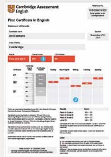
Statement of Results (pouze online)