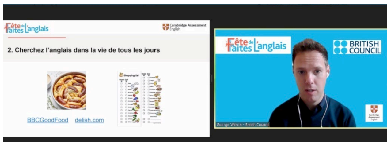
Capture d'écran de la conférence

« L'apprentissage de l'anglais doit être fun et non pas un fardeau. Cherchez des activités qui attirent l'attention de votre enfant. L'idéal est que l'activité prime sur le cours pour que l'étude de l'anglais passe inaperçue. »